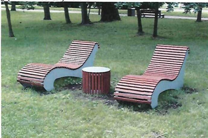
fot. pogładowa wizualizacja leżaka

d) stojaki miejskie na rowery z rury ocynkowanej- dwa skupiska po 3 sztuki stojaków - razem 6 sztuk. Minimalna wysokość stojaka - 85 cm, minimalna szerokość stojaka - 60 cm.